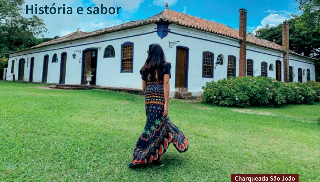
Charqueada São João

P ara quem gosta de destinos completos, Pelotas merece alguns dias de roteiro. Um dos pontos altos está na parte histórica da cidade, que viveu uma época áurea com a indústria do charque, principal economia no século 19. Por conta disso, as charqueadas são um dos principais atrativos e preservam tradições.