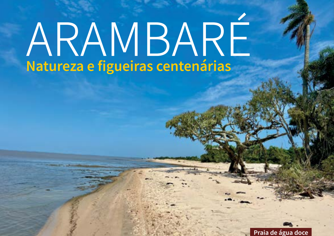
Praia de água doce

C om trilhas no meio da mata e uma variedade de figueiras centenárias, Arambaré tem passeios que permitem contato intenso com a natureza. Muitas atrações estão voltadas para a Lagoa dos Patos e, lógico, para as praias de água doce. O roteiro pode ser de um ou dois dias, dependendo das atividades que você deseja incluir na programação.