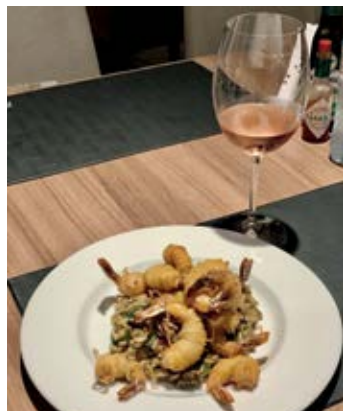
Restaurante Marcos - Laghetto