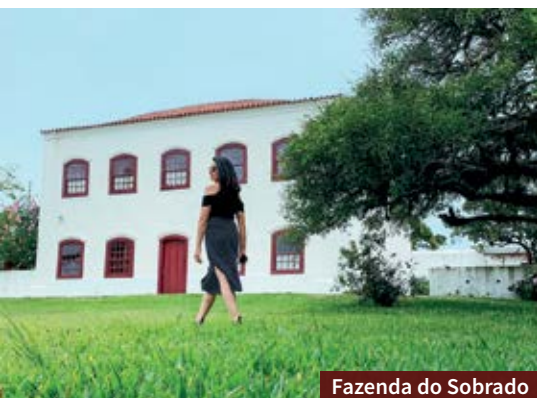
Fazenda do Sobrado

➤ Hotel das Figueiras: Com vista privilegiada para a Praia das Nereidas, tem área com piscina e ampla sala de café da manhã, com televisão e espaço para tomar chimarrão. Informações e reservas aqui