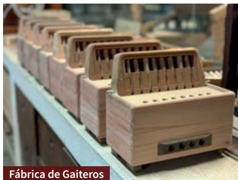
Fábrica de Gaiteros