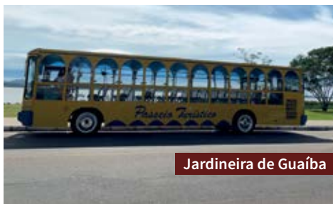
Jardineira de Guaíba

($) O ingresso é pago e as visitas devem ser agendadas.