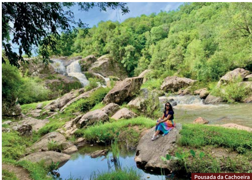
Pousada da Cachoeira

Morro Redondo é um daqueles lugares imersos na natureza. Por isso, indicamos que você leve roupas bem confortáveis e repelente nos passeios. Também não tenha pressa, porque é um destino para você contemplar e se conectar!