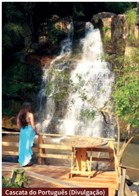
Cascata do Português

A igreja é uma ótima parada para quem gosta de turismo religioso e arquitetura de igrejas. Apesar de simples, a construção é charmosa, e o lugar é ideal para renovar as energias e se conectar com o sagrado.