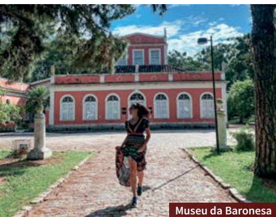
Museu da Baronesa

Os doces de Pelotas fazem parte da história e da tradição da cidade que tem forte influência portuguesa. Por isso, é quase obrigatório experimentar algum dos diversos doces pelotenses. Entre os principais estão os docinhos à base de ovos, como quindim e ninhos. Indicamos alguns lugares para você experimentar: Confeitaria Berola , Doçaria Monalu e Imperatriz Doces Finos .