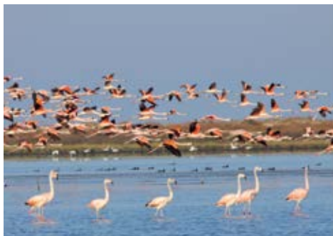
Flamingos na Lagoa do Peixe (Geiser Trivelato)

Pequeno e compacto, o centrinho reúne restaurantes, hotéis e um banco. Além disso, se estiver procurando por informações turísticas, vá ao Centro do Turista, que está localizado na praça central. No centro também há uma igreja que ganha bastante charme com o pôr do sol.