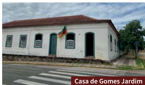
Casa de Gomes Jardim