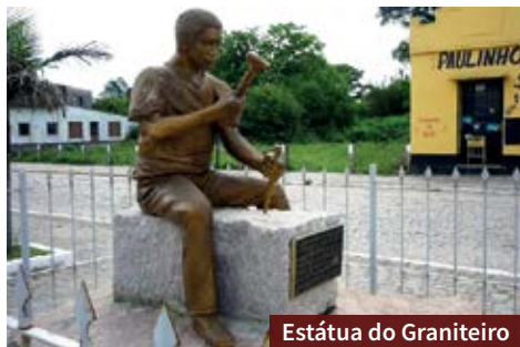
Estátua do Graniteiro