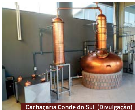
Cachaçaria Conde do Sul

Os vinhedos da Cárdenas ficam em um dos solos mais antigos do mundo, de formação granítica e de terrenos sinuosos. Com invernos rigorosos, verões com longos períodos de estiagem e altas insolações aliadas às brisas oriundas da Lagoa dos Patos, o terroir é único.