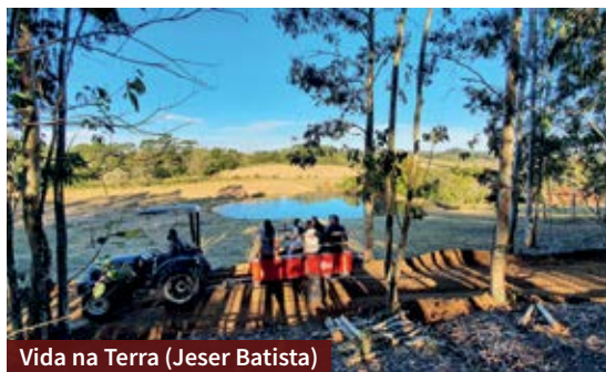
Vida na Terra (Jeser Batista)

Oferece vivências e experiências no campo. Tem plantação de frutas orgânicas, algumas delas que se transformam em sucos e geleias. Os visitantes podem percorrer a extensa área de 15 hectares a pé ou em trator.