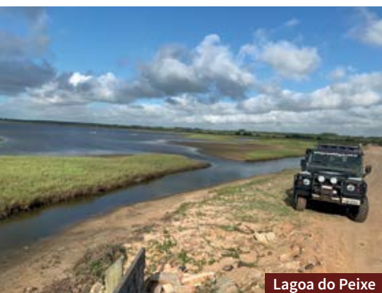
Lagoa do Peixe