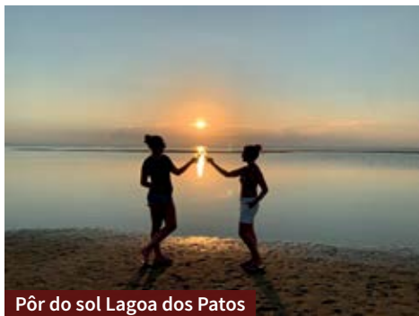
Pôr do sol Lagoa dos Patos