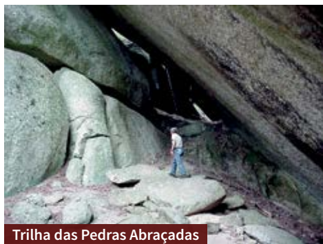
Trilha das Pedras Abraçadas

A aventura começa no pé do morro e segue sempre para cima. No percurso há uma sequência de rochas abraçadas por figueiras seculares.