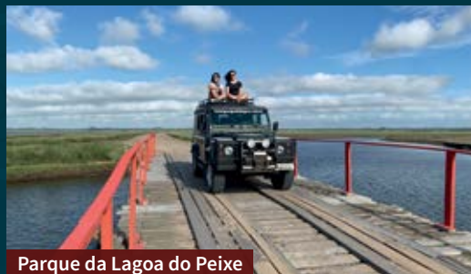
Parque da Lagoa do Peixe

Tavares é um destino que une aventura e muita natureza. Por isso, para alguns passeios você vai precisar de veículo 4x4, devido ao solo arenoso e aos trajetos no meio da água. Caso você não tenha ou não consiga alugar, a agência receptiva faz os passeios.