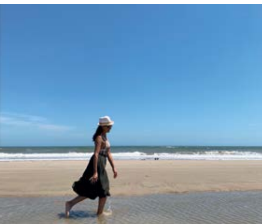
Praia do Hermenegildo