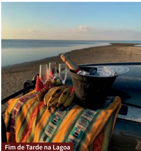
Fim de Tarde na Lagoa