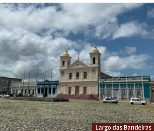
Largo das Bandeiras

Construída entre 1880 e 1883 com o objetivo de atender os oficiais e praças do exército, a antiga Enfermaria Militar fica no Cerro da Pólvora, ponto mais elevado da cidade. O prédio será restaurado e ali será instalado o Centro de Interpretação do Pampa, espécie de museu e complexo cultural ligado à Universidade Federal do Pampa.