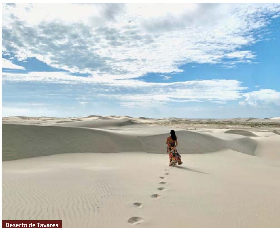
Deserto de Tavares

Também indicamos levar repelente e binóculo para avistar as aves - é fantástico descobrir diferentes espécies na viagem.