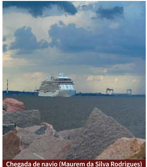
Chegada de navio (Maurem da Silva Rodrigues)

No passeio vale conhecer também o museu que fica no prédio da alfândega e possui uma coleção histórica que conta mais sobre a cidade. Também aproveite para conhecer o Museu Náutico, que tem como objetivo