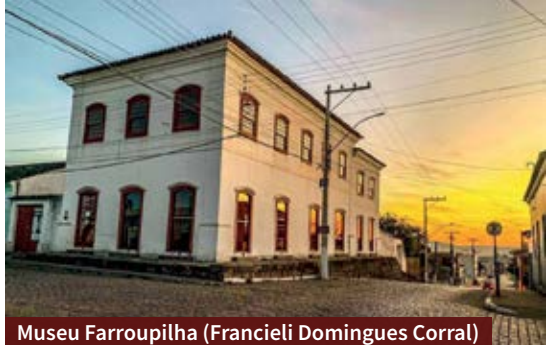
Museu Farroupilha (Francieli Domingues Corral)

diferentes pastéis, pizzas e opções de salgados. Ao meio-dia há buffet a quilo. Fica na Av. Gomes Jardim, 241.