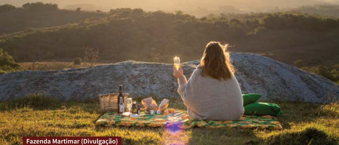
Fazenda Martimar

O turismo de Canguçu é inspirado na olivicultura, na agricultura familiar e na produção de uvas. Por isso, experiências entre árvores e olivais são garantidas aos turistas.