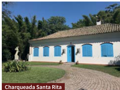
Charqueada Santa Rita

A Charqueada Boa Vista oferece espaço para eventos privados, como formaturas,