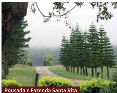
Pousada e Fazenda Santa Rita

> Pousada Fazenda Santa Rita - A hospedagem fica na zona rural e oferece aos visitantes comodidades e experiências, como churrasqueira, galpão com fogo de chão, parque infantil, participação na lida com os animais, passeio a cavalo, passeio de carroça, charrete e trator, pensão completa, pescaria, salão de eventos, trilha ecológica e comercialização de produtos coloniais.