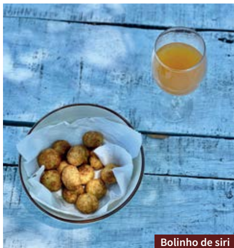
Bolinho de siri

A Lagoas Expedições e Turismo realiza passeios de Jeep pela Lagoa do Peixe e Lagoa dos Patos. Os passeios são personalizáveis e podem durar até 7h.