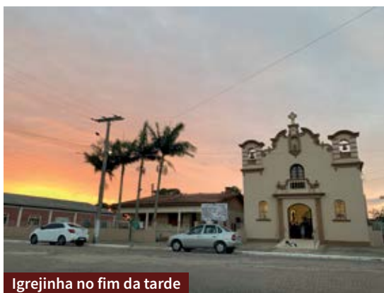
Igrejinha no fim da tarde