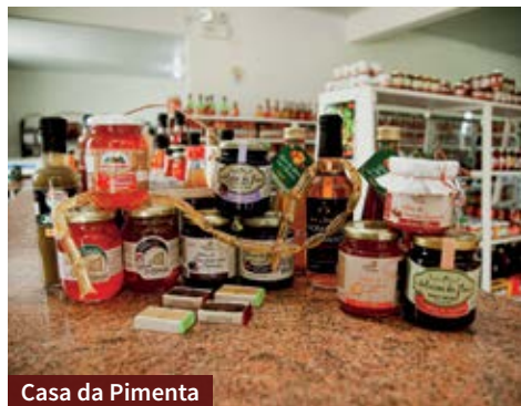
Casa da Pimenta