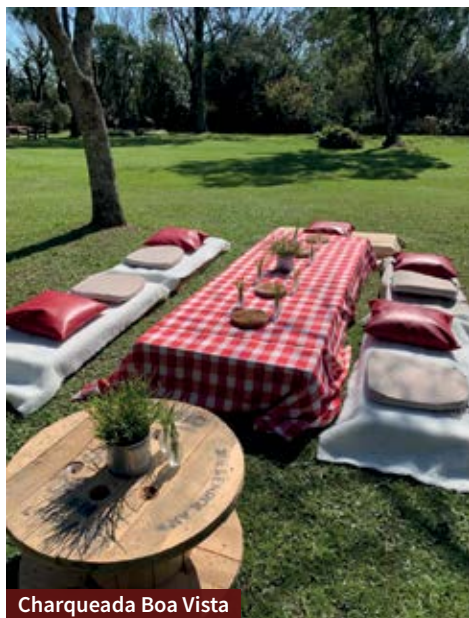
Charqueada Boa Vista

A Santa Rita também tem atividades ao ar livre e espaço na natureza. É possível andar a cavalo, de caiaque ou de canoa, andar de bicicleta, aproveitar a piscina e conhecer o Memorial do Charque.