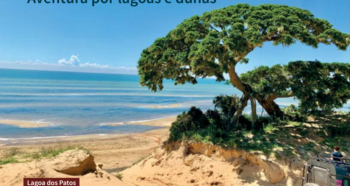
Lagoa dos Patos

D estino para quem busca contato com a natureza, Tavares é uma verdadeira joia da Costa Doce Gaúcha. A 230km de Porto Alegre, a cidade fica dentro do Parque Nacional da Lagoa do Peixe, o que faz da viagem uma experiência incrível e diferente.