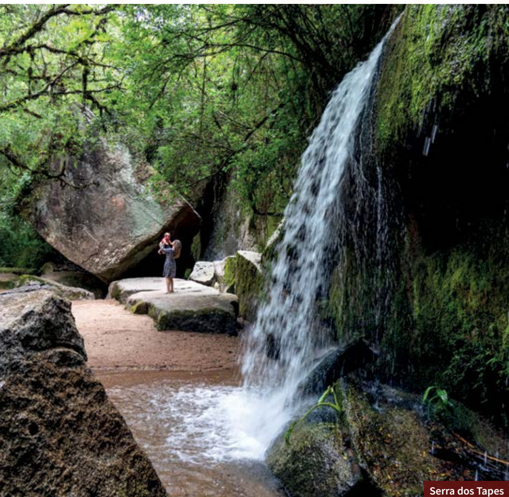
Serra dos Tapes