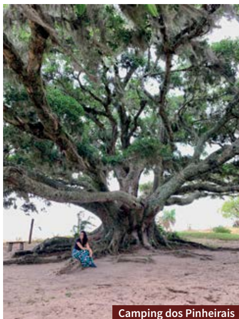
Camping dos Pinheirais

Para quem deseja conhecer ou até mesmo fazer um passeio de barco, o Clube Náutico Tapense reúne várias embarcações que vêm de outras cidades do Estado.