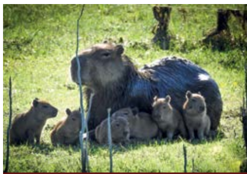
Capivaras no Taim (Maurem da Silva Rodrigues)