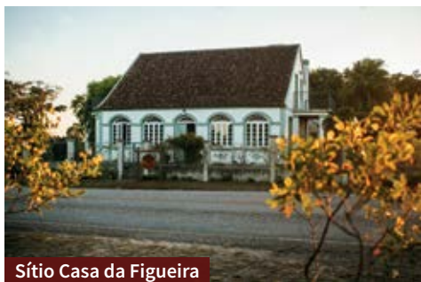
Sítio Casa da Figueira

Com fácil acesso, sem estradas de chão, o sítio dispõe de jardim, trilhas, áreas de contemplação e o mais lindo pôr do sol da região!